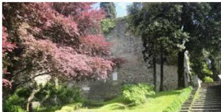
Il Parco delle Rimembranze

Quota di partecipazione: € 7,00 - bambini gratis - Non è richiesta prenotazione