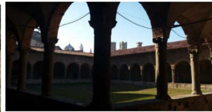
il convento di San Francesco