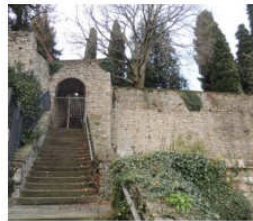
la "scala del condannato"