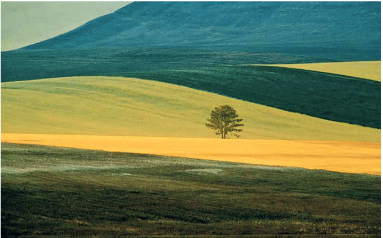
Franco Fontana - Basilicata 1978

Durante l’esposizione saranno organizzati laboratori, convegni e incontri.