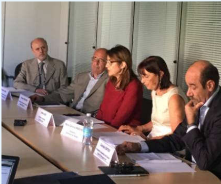
Foto: Conferenza stampa presentazione Piani di Zona, 19 giugno 2018

Per i cittadini bergamaschi questa è una notizia importante: basti pensare che nel territorio dell'ATS di Bergamo gli interventi riguardano più di 100.000 persone, con un investimento nel sociale che in dieci anni è passato da 90 agli attuali 140 milioni di euro all'anno, registrando un aumento delle risorse allocate nelle aree disabilità, minori e famiglie. il tutto con una propensione alla gestione associata