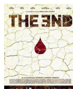
Locandina del film