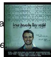
La locandina del corto

Una commedia riflette probabilmente il pessimismo della nostra generazione. Ad ogni modo un film stupendo.