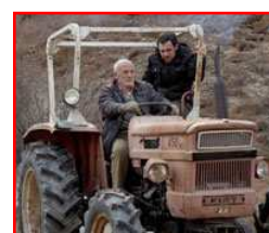
Philippe Leroy con Elio Germano

Back Stage a cura di Tommaso De Micheli - 03:20: è composto da immagini relative ad alcune scene inedite del corto con le dichiarazioni e impressioni del regista, della scenografa e degli attori.