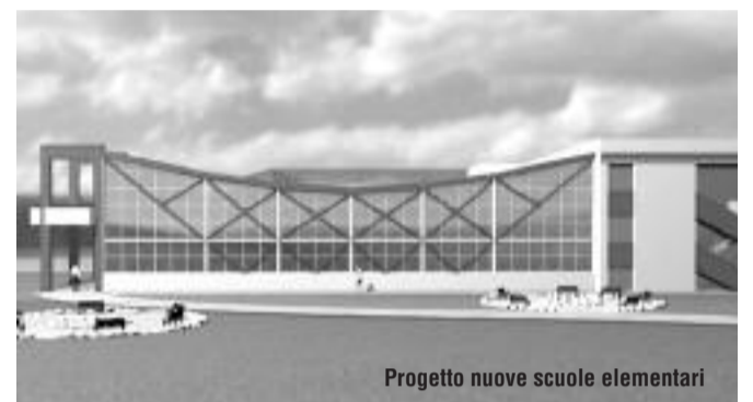
Progetto nuove scuole elementari

considerare non più utili e che invece, grazie anche alle proposte arrivate direttamente dalla popolazione (in questo caso il nostro concit-